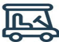
[ Golf Cart ]