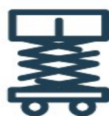
[ Aerial Work Platform ]